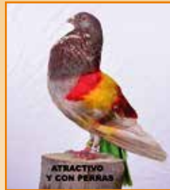
ATRACTIVO Y CON PERRAS

Informacion facilitada por Adrián Caballero