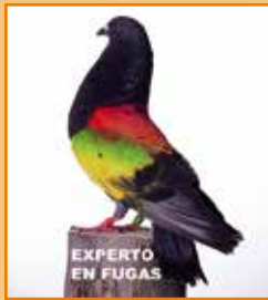
EXPERTO EN FUGAS