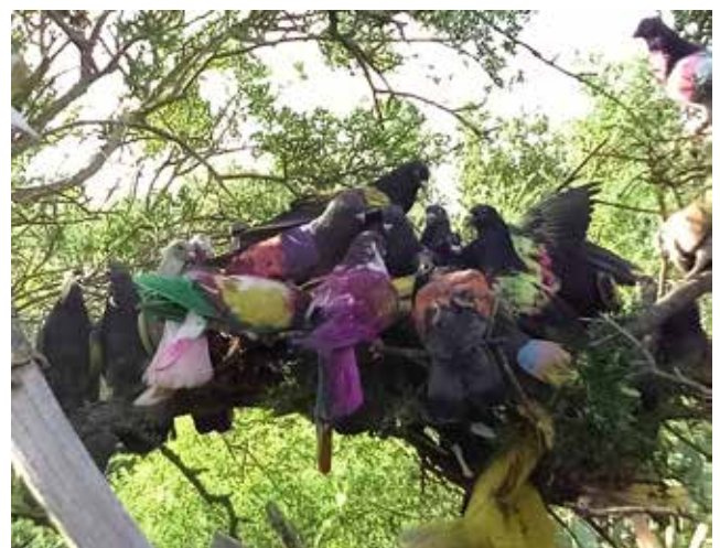
Instante de la sexta prueba (Eduardo Mesa).